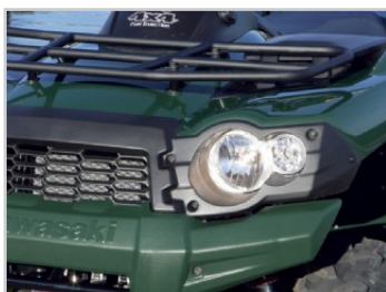
UN NOUVEAU DESIGN DE PARE-CHOCS