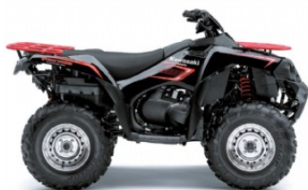
Super Black (Noir)