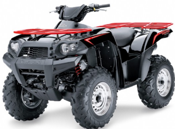
Année modèle 2008