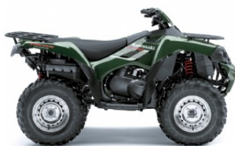
Woodsman Green (Vert foncé)