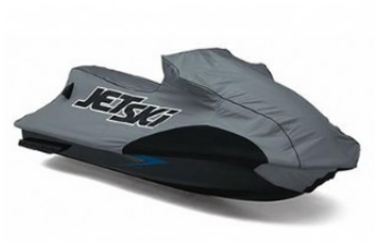
BACHE € 319,00